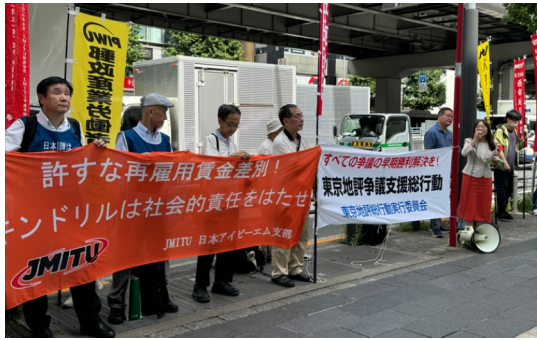
キンドリルジャパン本社前行動

インドリルジャパン社員の給与は生活できない水準だ、これを満足に生活ができる水準に改善し、会社として社会的責任を果たすべきだと訴えました。