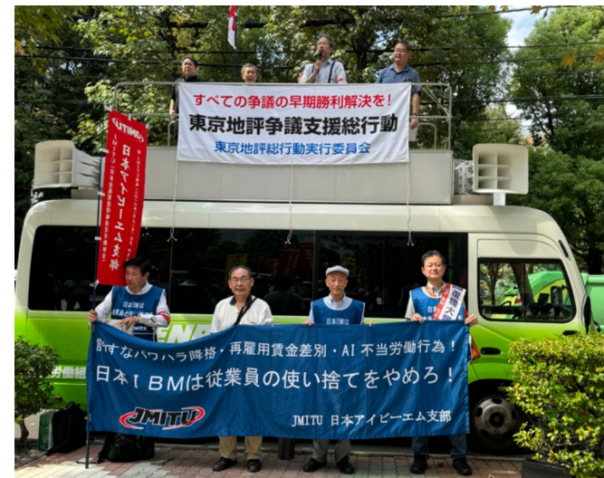
日本IBM箱崎事業所前行動

さらに、賃上げが1回分少ない状況(本来、就業規則通りに賃上げが実施されるべき)を、賃上げが実施されるべきだと訴えました。