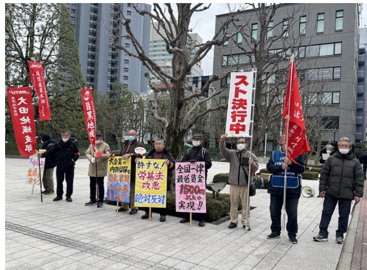
日本IBM箱崎事業所前ストライキ行動

日本IBM箱崎事業所前でのストライキ行動に続いて、ノバ・バイオメ 日本IBM箱崎事業所前でのストライキ行動に続いて、ノバ・バイオメ